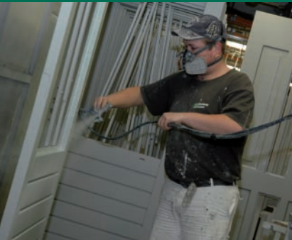
Geschikt voor watergedragen verf