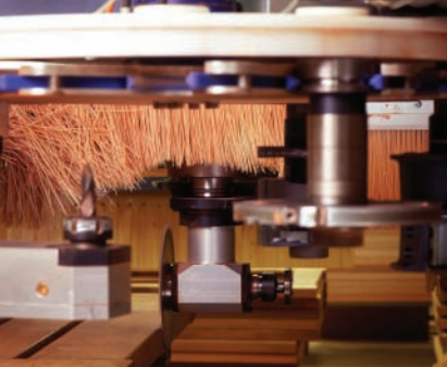
Bewerken met regulier gereedschap